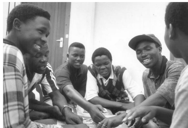
Educateurs pairs, Afrique du Sud.