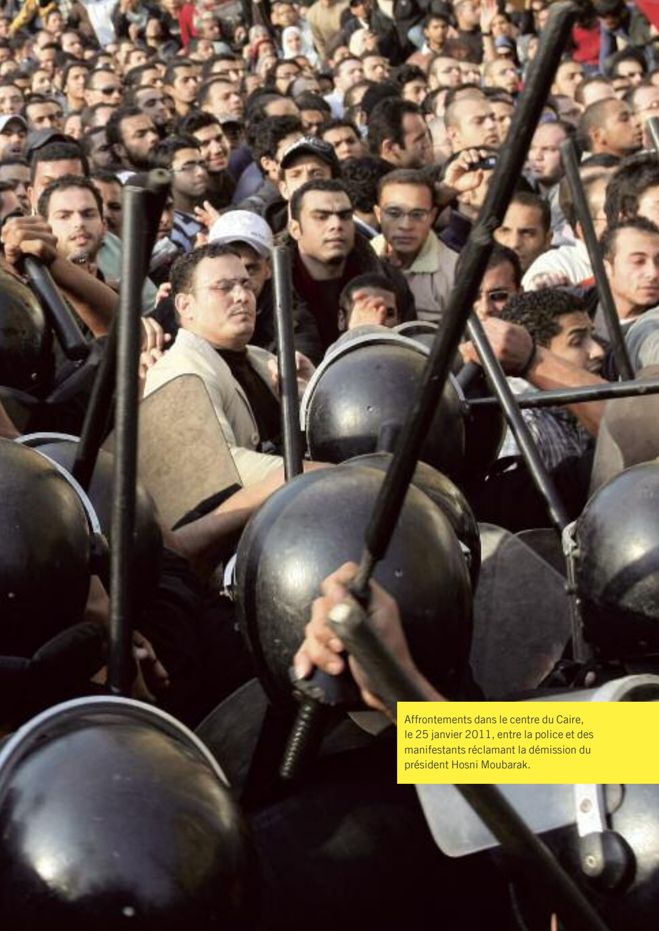
Affrontements dans le centre du Caire, le 25 janvier 2011, entre la police et des manifestants réclamant la démission du président Hosni Moubarak.