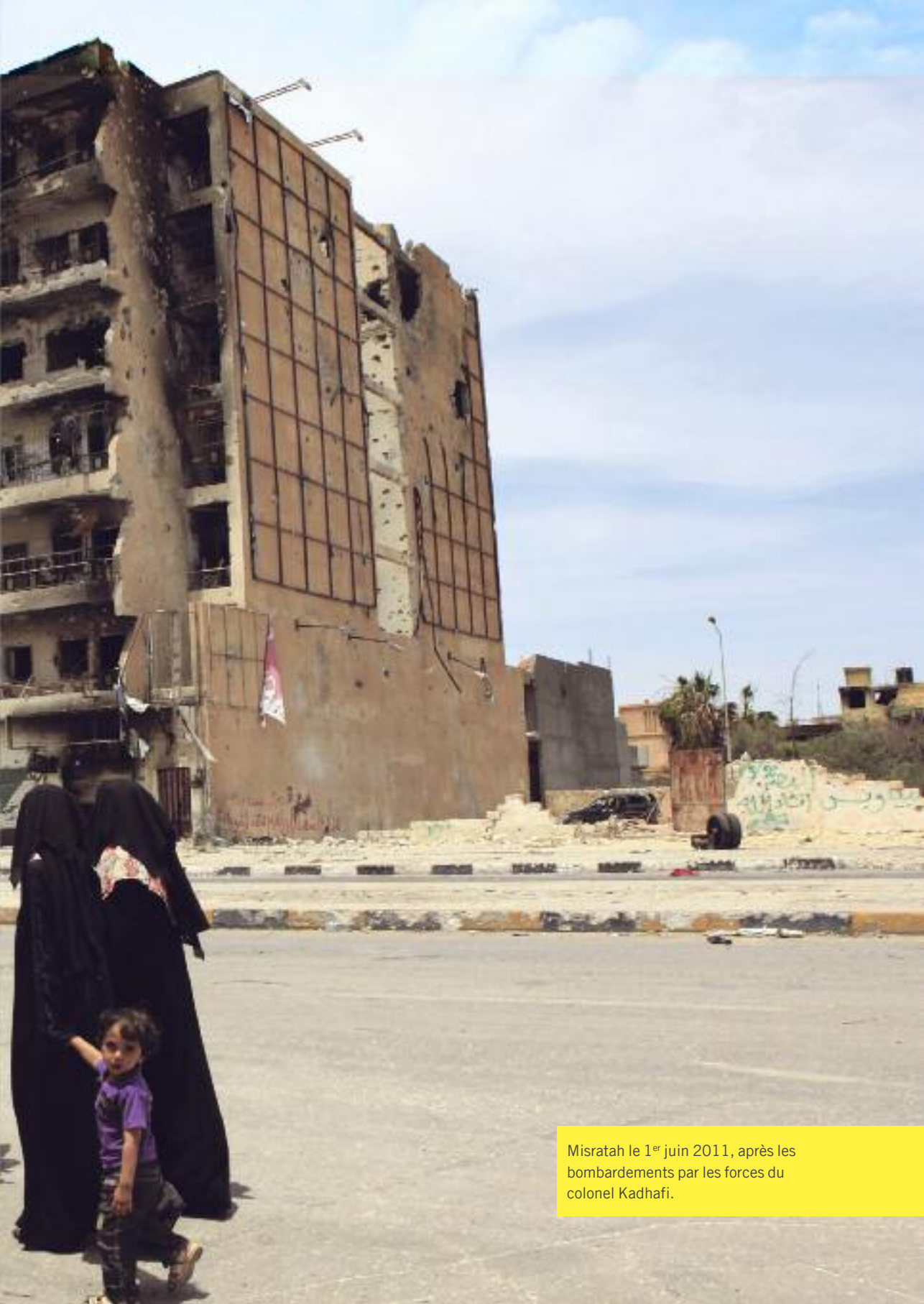
Misratah le 1 er juin 2011, après les bombardements par les forces du colonel Kadhafi.