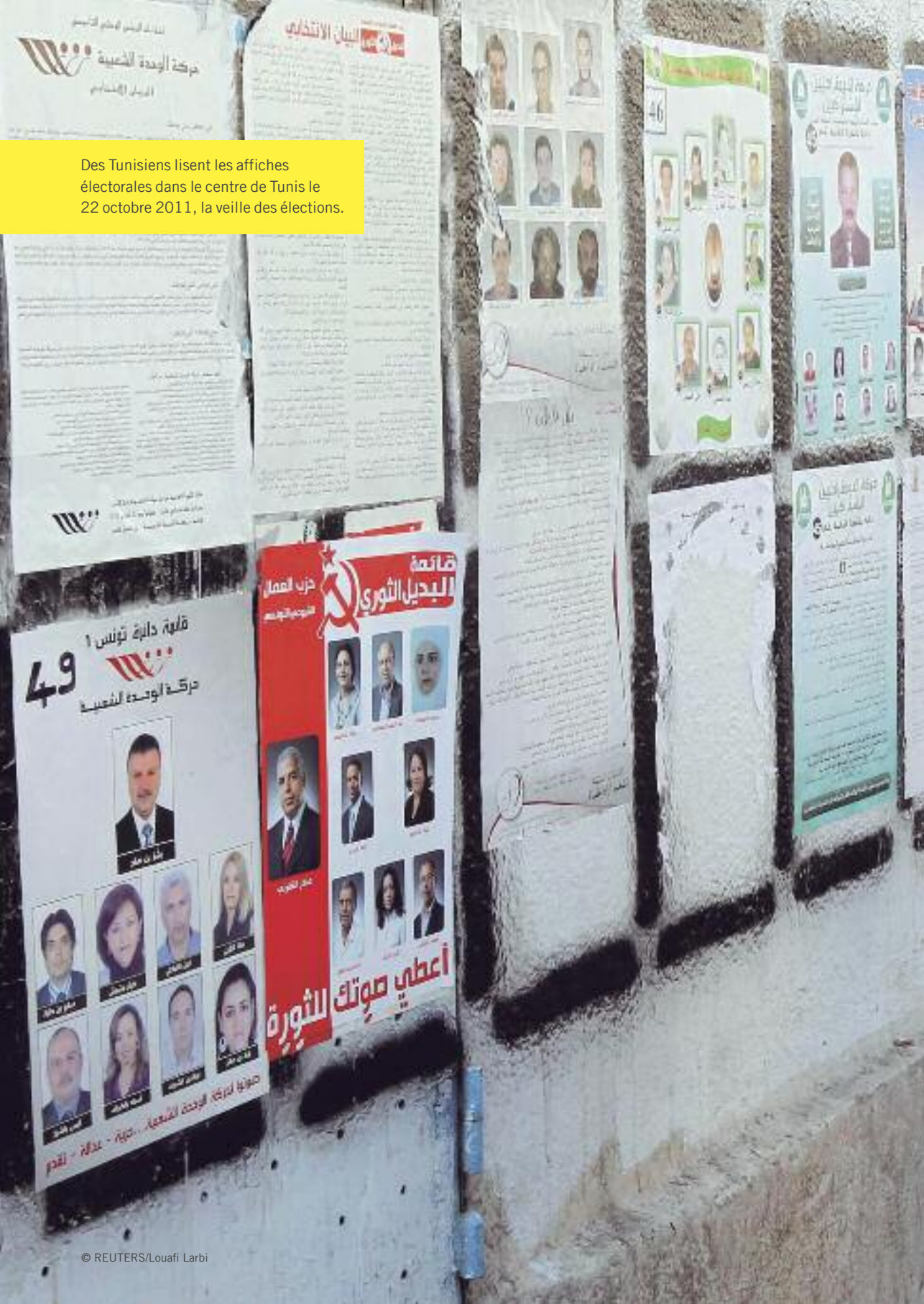
Des Tunisiens lisent les affiches électorales dans le centre de Tunis le 22 octobre 2011, la veille des élections.