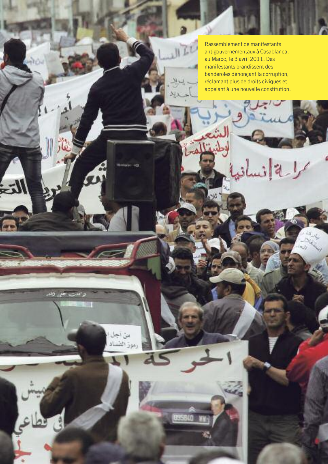
Rassemblement de manifestants antigouvernementaux à Casablanca, au Maroc, le 3 avril 2011. Des manifestants brandissent des banderoles dénonçant la corruption, réclamant plus de droits civiques et appelant à une nouvelle constitution.