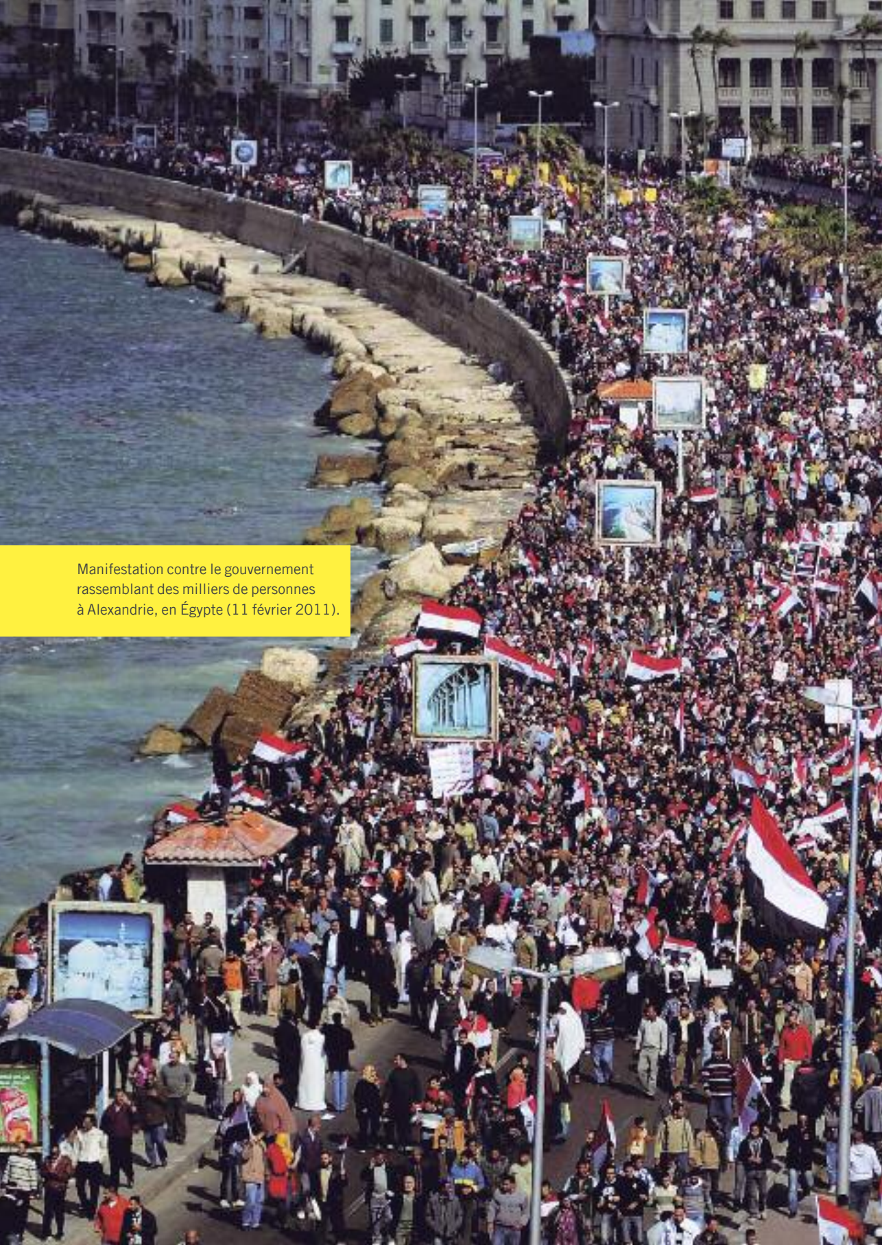
Manifestation contre le gouvernement rassemblant des milliers de personnes à Alexandrie, en Égypte (11 février 2011).