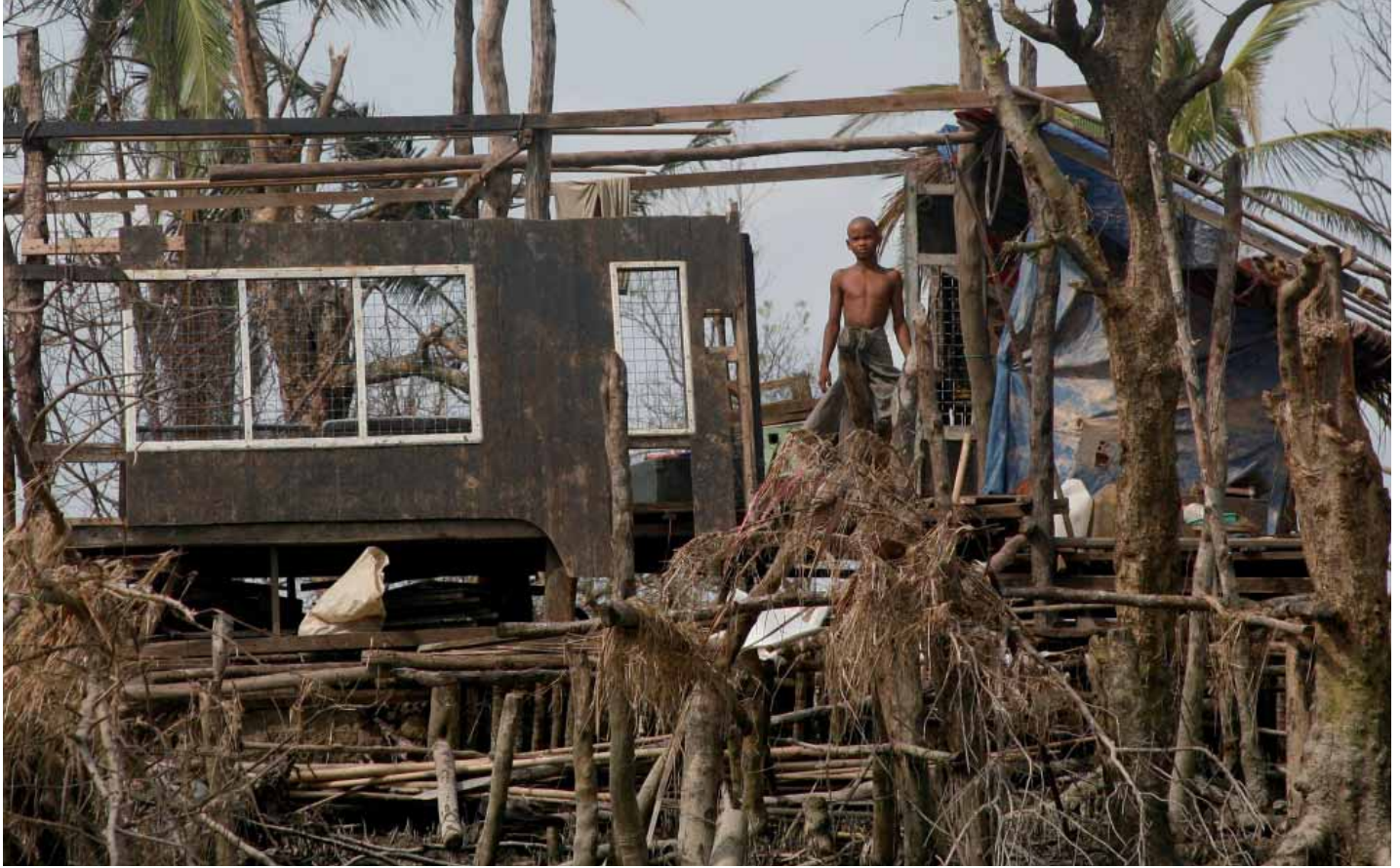
▲ Un garçon au milieu des ruines de sa maison, après que celle-ci ait été détruite au passage du cyclone Nargis au Myanmar, en 2008.

nelles sur la protection des personnes affectées par des catastrophes naturelles, directives que le HCR a contribué à rédiger et à tester sur le terrain. Elles expliquent comment les catastrophes naturelles mettent à mal les droits de l'homme et elles proposent un classement des mesures de protection à prendre dans ces situations.