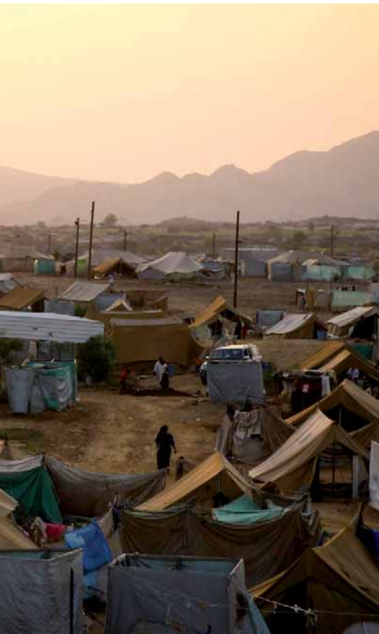
◀ Ce camp, au nord-ouest du Yémen, accueille des civils déplacés par le conflit.

Ces dernières années, la communauté internationale s'est employée à améliorer la réponse apportée aux déplacements internes et à la rendre plus prédictible et fiable. La communauté internationale comprend un large éventail d'acteurs gouvernementaux et d'ONG impliqués dans l'assistance humanitaire et dans la coopération au développement. S'y ajoutent des civils et du personnel militaire associés à la consolidation et au maintien de la paix. Dans les situations d'urgence, les travailleurs humanitaires distribuent des vivres, acheminent de l'eau par camions, montent des tentes et prodiguent des soins de santé. Mais, lorsqu'une protection physique est nécessaire, les humanitaires atteignent rapidement les limites de leurs compétences.