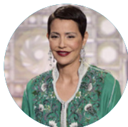
S.A.R Princesse Lalla Meryem Présidente de la Fondation Hassan II