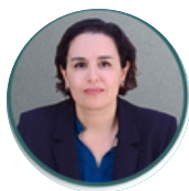
Présidente de la Cour régionale des Comptes de la Région de Rabat-Salé-Kénitra