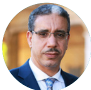
M. Aziz Rabbah Ancien Ministre de l'Energie, des Mines et de l'Environne- ment du Maroc