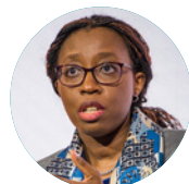
Dr. Vera Songwe Présidente du Conseil d'Administration de la Liquidity & Sustainability Facility