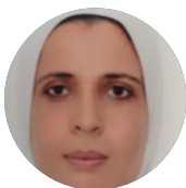
Mme Hayat Elyadouni Magistrate à la cour des comptes du Maroc